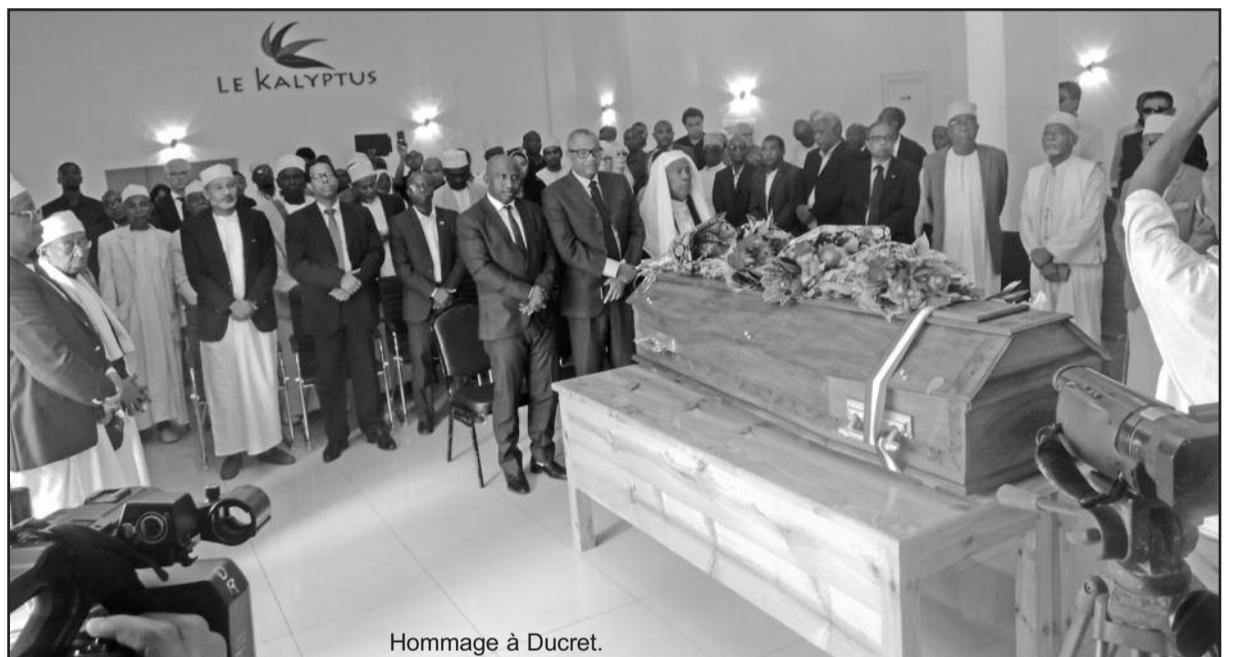
Hommage à Ducret.

« C'est vrai, il était de nationalité française mais il avait aussi la nôtre, par conviction. Plus de 52 ans qu'il a travaillé pour notre pays, c'est vraiment énorme », témoigne